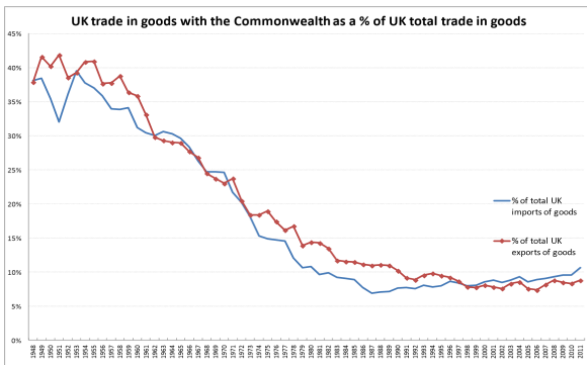
Рисунок А 1 – Диаграмма торговли товарами Великобританией со странами Содружества в процентном соотношении от общей торговли товарами Великобритании

Примечание – Источник: Шишков Ю. В. Судьба Британского содружества наций: воспоминание о будущем СНГ // Общественные науки и современность . 1996, № 3, С. 73 – 85.